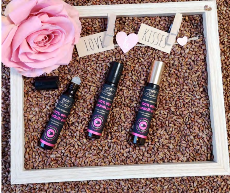
Kép 5: Szőlőmagolaj az ajakápoláshoz

Alkalmazható nedves bőrre masszázshoz vagy testápoláshoz, vagy illóolajokat adhat hozzá a további előnyök érdekében.