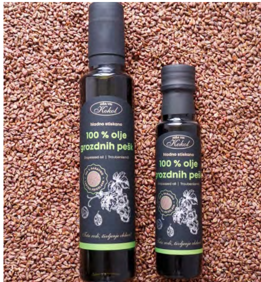
Kép 2: Szőlőmagolaj

Egész szőlőmagot is árulnak, amelyért a Pohorje, Kozjak, Slovenske gorice, Maribor, a Dráva-völgy és a Dráva mezeje régióval együtt elnyerte az Our Best minőségi tanúsítványt. A szőlőmag nagyon magas koncentrációban tartalmaz E-vitamint, flavonoidokat, linolsavat és procianidin nevű vegyületeket (más néven kondenzált tanninokat, piknogenolokat és oligomer proantocianidineket),