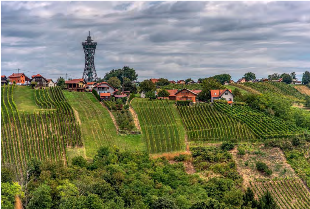
Kép 1: Lendava Gorice

A Pomurje régióban, különösen a Prekmurje körzetben a szőlőtermelők korszerkezete az egyik legkedvezőtlenebb Szlovéniában, ami a szőlőültetvények csökkentésének és elhagyásának tendenciájában tükröződik. A borfogyasztás és sok helyen a bor ára is csökken. Hosszú távon a bioszőlőültetvények és a bioborok csak azoknál a bortermelőknél fognak növekedni, akiknek sikerül piacot találniuk elsősorban az integrált szőlőtermesztésből származó boroknak, majd közvetett módon, a vásárlók egy részét sikeresen befolyásolva a bioborok iránt. Az is lényeges, hogy a bortermelők összefogjanak, hogy közös hangot hallassanak a piacon.