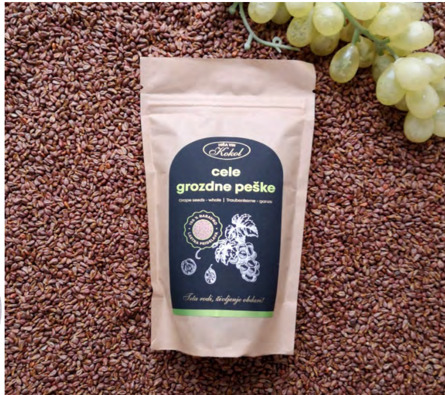
Kép 3: Szőlőmagok